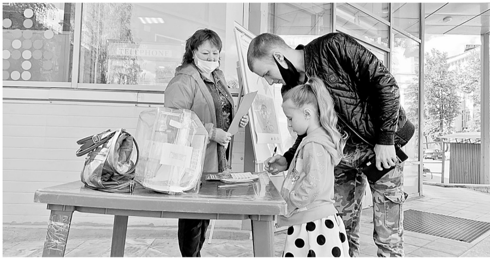
Проголосовать в мобильных пунктах боровичанам помогли волонтеры

— Мобильные точки работали с понедельника по пятницу, по четыре часа в день. Кроме того, волонтеры провели голосование на крупных мероприятиях города. Часто боровичане подходили к пунктам для голосования группами, с интересом обсуждали предлагаемые места, иногда спорили, взвешивая аргументы за и против, и голосовали. Всем участникам голосования мы предлагали зарегистрироваться. Многие воздерживались от регистрации, но при этом хотели участвовать в выборе места под стелу. В итоге мы решили дать возможность проголосовать всем желающим.