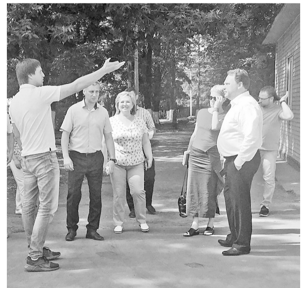
Идёт приёмка работ по благоустройству Екатерининской площади

— Видно, что в Боровичском районе ни одна из инициатив, которые могут принести пользу муниципалитету, не пропущена. Район участвует как в федеральных, так и в региональных программах. И общественный контроль реализации данных инициатив на различных этапах — это залог успеха, — подытожил Артём Кирьянов. Он также отметил, что за последние годы город расцвел и сюда хочется приезжать.