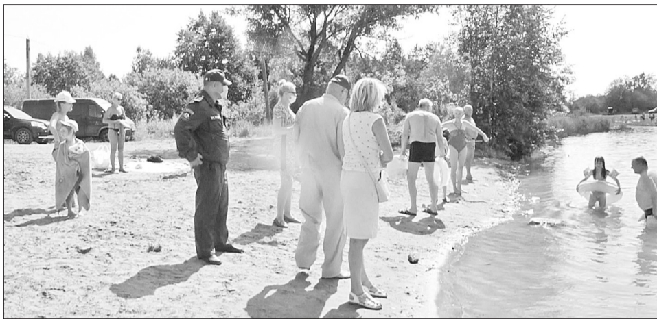
На карьере в местечке Усть-Брынкино. Рейд по пресечению купания в запрещённых местах

Купальный сезон влечёт за собой немало опасностей. Так, по официальным данным Центра ГИМС по Новгородской области, в первом летнем месяце (данные на 29 июня) на водных объектах региона погибло 9 человек, четверо из них — дети. В эту печальную статистику попал и наш Боровичский район.