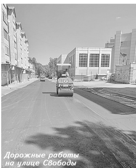
Дорожные работы на улице Свободы